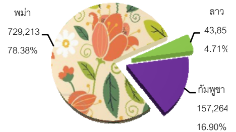
แผนภูมิ แสดงสัดส่วนของแรงงานต่างด้าว 3 สัญชาติ

งานที่ได้รับอนุญาตทำงานใน 2 ตำแหน่งงานคือ งานกรรมกร และงานรับใช้ในบ้าน ใน 24 ประเภทกิจการ