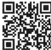
แผ่นป้าย ขนาด ๒.๔๐