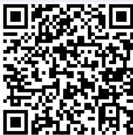
QR CODE วิธีการลงทะเบียน