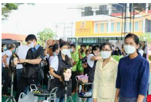
รวบรวมโดย : ศูนย์บริหารข้อมูลตลาดแรงงานภาคตะวันออก ที่มา : www.dailynews.co.th

นอกจากนี้ยังมีการประชาสัมพันธ์ให้บุตรหลานที่สนใจหันมาเรียนสายอาชีพ ที่วิทยาลัยเทคนิคนิคมอุตสาหกรรมระยอง โดยทางวิทยาลัยฯ มุ่งพัฒนาผู้เรียนและกำลังคนสู่สถานประกอบการในนิคมอุตสาหกรรมทั้ง 5 แห่งใน จ.ระยอง มุ่งเน้นให้นักเรียน นักศึกษามีรายได้ระหว่างเรียน ตามโครงการเด็กหนีเรียนครูหนีสอน ไปประกอบอาชีพ เรียนรู้จากประสบการณ์การทำงานจริง สู่การต่อยอดธุรกิจว่าที่เศรษฐีคนต่อไป สร้างช่างเทคนิคสู่วิศวกรด้วยโครงการบัณฑิตพันธุ์ใหม่ อาทิ เช่น มหาวิทยาลัยเทคโนโลยีราชมงคลธัญบุรี มหาวิทยาลัยรามคำแหง มหาวิทยาลัยเทคโนโลยีราชมงคลตะวันออก เป็นต้น