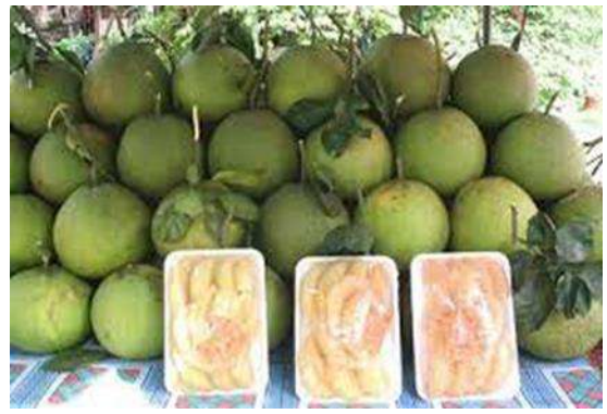
รวบรวมโดย : ศูนย์บริหารข้อมูลตลาดแรงงานภาคตะวันออก ที่มา : https://www.bangkokbiznews.com

ขณะที่เกษตรกรและผู้ส่งออกจะต้องปรับตัวหลายเรื่อง ทั้งในเรื่องของแหล่ง (ล้ง) รับซื้อ การเตรียมโรงบรรจุ และต้องผ่านมาตรฐาน GMP (Good Manufacturing Practice) คือ มาตรฐานอาหารระหว่างประเทศ รวมถึงการขึ้นทะเบียนกับกรมวิชาการเกษตร และที่สำคัญคือต้องมีการฉายรังสีมากกว่า 400 เกรย์ ซึ่งการใช้รังสีเป็นการยืดอายุการเก็บรักษา ควบคุมการงอก ชะลอการสุกของพืชผักและผลไม้ และเป็นการกำจัดแมลงและไล่ศัตรูพืชอีกทางหนึ่งด้วย ขณะนี้โอกาสในพื้นที่ทำการเกษตรของจังหวัดนครปฐมนั้นแทบจะเต็มพื้นที่แล้ว เนื่องจากพื้นที่ทางการเกษตรลดลง พื้นที่ถูกนำไปใช้ทำประโยชน์อย่างอื่น ประกอบกับคนรุ่นใหม่ไม่สนใจประกอบอาชีพทางการเกษตร การจะเพิ่มผลผลิตจึงต้องขยายไปยังจังหวัดที่มีพื้นที่ขนาดใหญ่และให้ความรู้ที่ชัดเจนแก่เกษตรกรผู้เพาะปลูกต่อไป