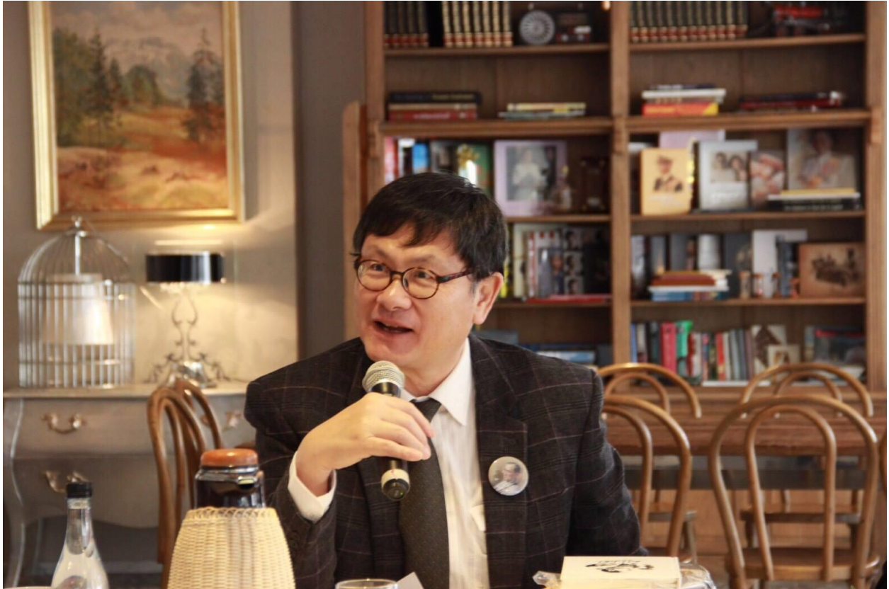
ดร.เอนก เหล่าธรรมทัศน์

ดร.เอนก เหล่าธรรมทัศน์ รัฐมนตรีว่าการกระทรวงอุดมศึกษา วิทยาศาสตร์ วิจัยและนวัตกรรม หรือ อว. กล่าวถึงการเรียนการสอนยุคใหม่ว่า ต้องทำให้นิสิตนักศึกษามองเห็นอนาคตของตนเอง ครูยุคใหม่ ต้องสร้างความเข้าใจ รับฟังความคิดเห็นและปรับทิศทางการทำงาน ต้องปรับเปลี่ยนตามเด็กซึ่งไม่ใช่เพียงนิสิตนักศึกษา แต่รวมถึงเยาวชนของประเทศด้วย เขาอยากเรียนอะไร อยากให้การเรียนรู้ใน อุดมศึกษาเป็นอย่างไรต้องปรับตาม ไม่ใช่กระทรวงอว.กำหนดแล้วให้เด็กทำ