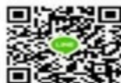
Line สำนักงาน