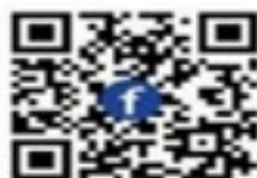
Facebook สำนักงาน

*** ตำแหน่งงานว่างอาจมีการเปลี่ยนแปลง หากมีข้อสงสัยติดต่อสอบถามที่ สำนักงานจัดหางานจังหวัดสุพรรณบุรี โทร. 0 3553 5308 ต่อ 102 ***