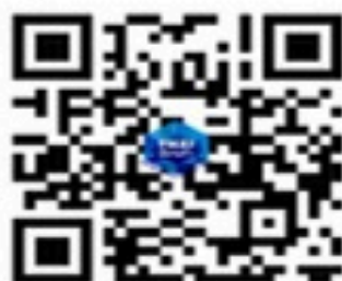
แสกนเพื่อขึ้นทะเบียนหางาน