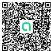
QR Code งานต่างประเทศ