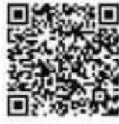
QR Code : ประกาศรับสมัคร