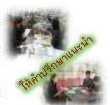
ให้คำปรึกษาแนะนำ