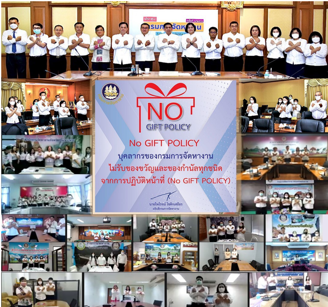
ภาพข่าวประชาสัมพันธ์การประชุมกรมการเจ้าหน้าที่ครั้งที่ ๓/๒๕๖๖ โดยมีท่านอธิบดีกรมการเจ้าหน้าที่มอบนโยบาย No Gift Policy และร่วมกับผู้บริหารและเจ้าหน้าที่ทำสัญลักษณ์ต่อต้านการทุจริต