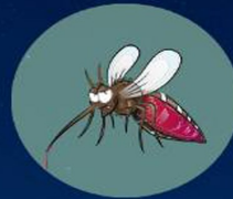
ยุงก้นปล่องที่มี เชื้อมาลาเรีย