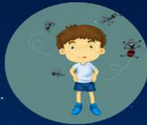
ผู้ป่วยมาลาเรีย