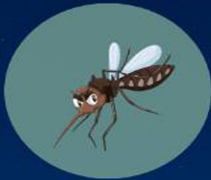
ยุงก้นปล่อง