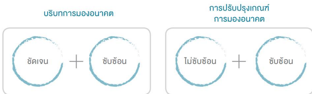
ภาพที่ 4 กรอบการวิเคราะห์ความสลับซับซ้อนของอนาคต

2.5) ท่านสามารถระบุระดับการวิเคราะห์ (Level of Analysis) และหน่วยวิเคราะห์ (Unit of Analysis) ของอนาคตได้หรือไม่? (Can you specify the level of analysis and unit of analysis for your futures?) หมายถึง สามารถระบุได้หรือไม่ว่า ประเด็นที่สนใจมองอนาคตนั้นเป็นประเด็นระดับปัจเจก (Individual Level) ระดับองค์กร (Organization Level) ระดับชุมชน (Community Level) หรือระดับมหภาค (Macro Level)