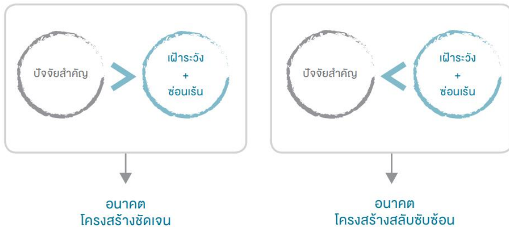
ภาพที่ 3 กรอบการวิเคราะห์สภาพแวดล้อมเชิงลึกตามประเด็นการมองอนาคต

จากกรอบการสำรวจสภาพแวดล้อมเชิงลึกข้างต้น หากประเด็นที่ต้องการมองอนาคตมี “ปัจจัยสำคัญ” มากกว่า “ปัจจัยที่ต้องเฝ้าระวัง” และ “ปัจจัยสำคัญซ่อนเร้น” จะถือว่าเป็น “อนาคตที่มีโครงสร้างชัดเจน (Structured Futures)” แต่ในทางกลับกันหากประเด็นมี “ปัจจัยที่ต้องเฝ้าระวัง” และ “ปัจจัยสำคัญซ่อนเร้น” ร่วมกันมากที่สุดจะถือเป็น “อนาคตที่มีโครงสร้างสลับซับซ้อน (Ill-structured Futures)”