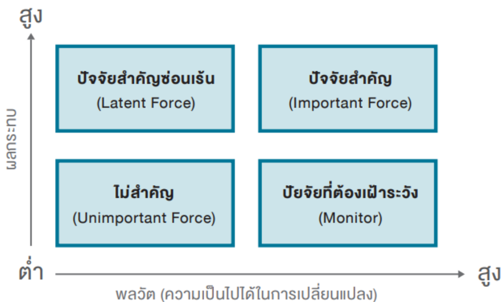
ภาพที่ 2 กรอบการวิเคราะห์สภาพแวดล้อมเชิงลึก

สิ่งสำคัญในการสำรวจสภาพแวดล้อมเชิงลึก คือ การวิเคราะห์ว่า “ปัจจัยขับเคลื่อน (Driver)” หรือ “แรงขับเคลื่อน (Driving Force)” ใดมีพลวัตความเป็นไปได้ในการเปลี่ยนแปลงสูง และมีผลกระทบต่ออนาคตที่ต้องการวิเคราะห์มากที่สุด โดยสามารถใช้กรอบการวิเคราะห์ต่อไปนี้