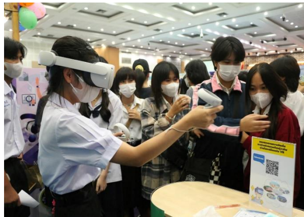
1.2 กิจกรรมแนะแนวอาชีพและส่งเสริมอาชีพให้เด็กและเยาวชนในสถานพินิจ ผู้ถูกคุมประพฤติ และผู้ต้องขัง จำนวน 6,213 คน จากเป้าหมาย จำนวน 6,000 คน คิดเป็นร้อยละ 103.55