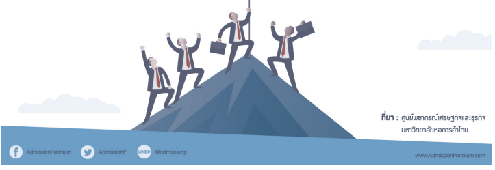
ที่มา : ศูนย์พยากรณ์เศรษฐกิจและธุรกิจ มหาวิทยาลัยหอการค้าไทย

AdmissionPremium AdmissionP @admissionp www.AdmissionPremium.com