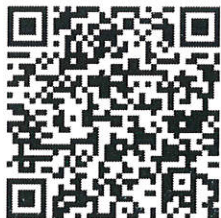
วิธีการลงทะเบียน