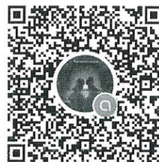
ผู้สมัครงาน MGM 2/67