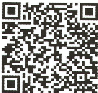
QR Code วิธีการลงทะเบียน และการรับสมัคร