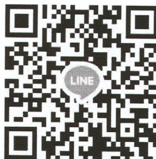
QR Code สำหรับผู้สมัคร สแกนเข้ากลุ่มไลน์