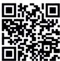
QR-code การรับสมัคร