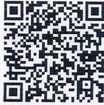
QR Code: ขั้นตอนที่ ๑ วิธีการลงทะเบียน