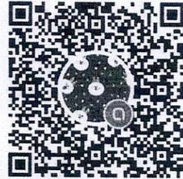
QR Code ไลน์กลุ่ม “ผู้สมัครงานวันโด้ ๒-๖๗”