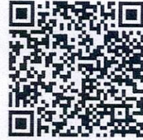
QR Code: ขั้นตอนที่ ๒ วิธีการสมัคร