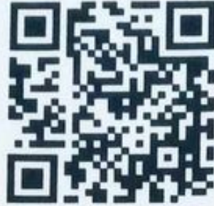
(QR Code รับสมัคร)