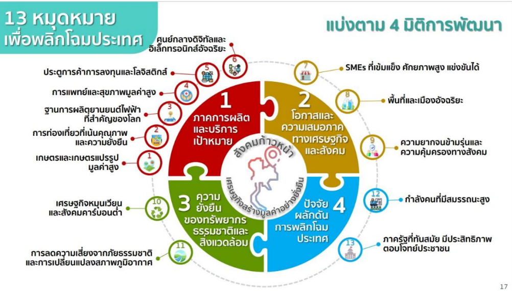
ภาพที่ ๒-๑ ภาพแสดงกรอบแผนพัฒนาเศรษฐกิจและสังคมแห่งชาติ ฉบับที่ ๑๓

สรุปสาระสำคัญของแผนพัฒนาเศรษฐกิจและสังคมแห่งชาติ ฉบับที่ ๑๓ ดังต่อไปนี้