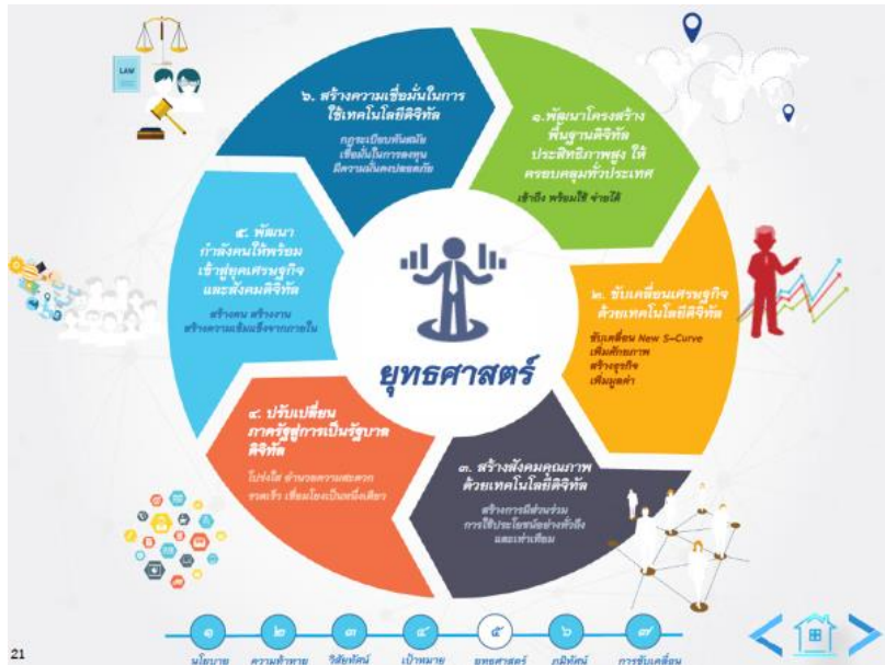
ภาพที่ ๒-๒ ภาพแสดงยุทธศาสตร์แผนพัฒนาดิจิทัลเพื่อเศรษฐกิจและสังคม ระยะเวลา ๒๐ ปี