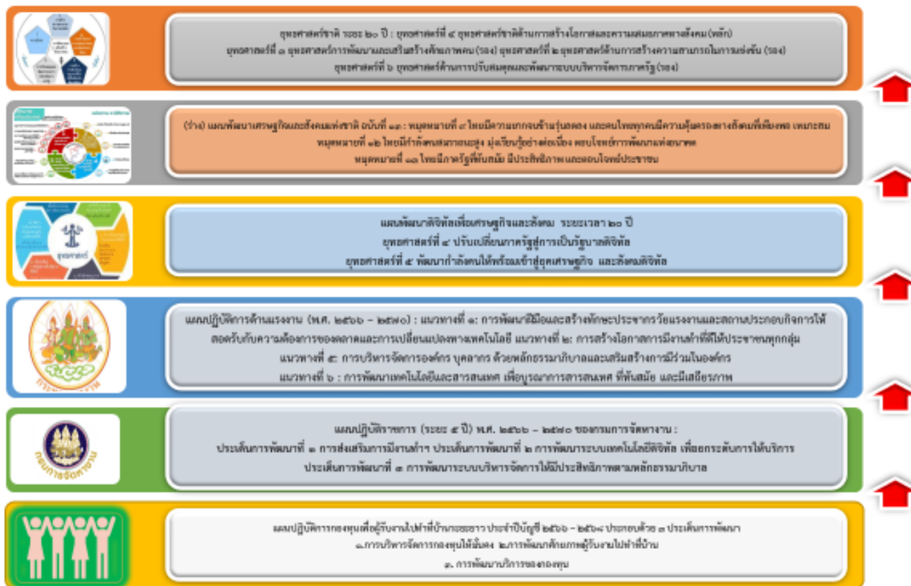
ภาพที่ ๓-๒ ภาพผังแสดงความเชื่อมโยงระหว่าง แผนปฏิบัติการกองทุนเพื่อผู้รับงานไปทำที่บ้านระยะยาว ประจำปีบัญชี ๒๕๖๗ - ๒๕๖๙ กับแผนระดับที่ ๑ - ๓ ที่เกี่ยวข้อง