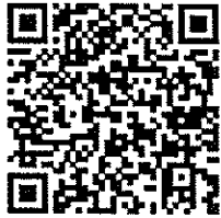
วิธีการลงทะเบียน