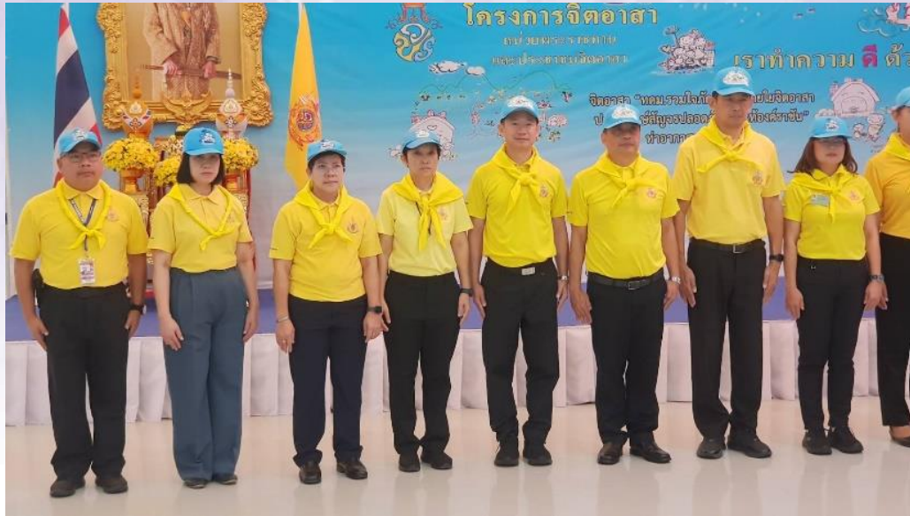
ร่วมกิจกรรม โครงการจิตอาสา หน่วยพระราชทาน และประชาชนจิตอาสา