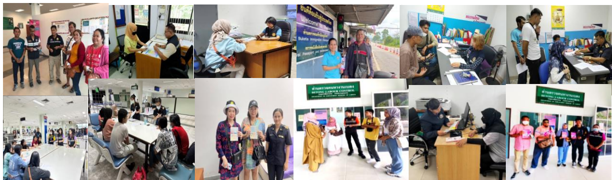
ให้คำแนะนำ/ปรึกษา การเดินทางไปทำงานต่างประเทศ พร้อมทั้งเผยแพร่ข้อมูลข่าวสารการเดินทางไปทำงานต่างประเทศด้วยวิธีที่ถูกต้องตามกฎหมาย