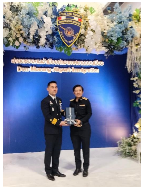
ร่วมงานกับ กองบังคับการตรวจคนเข้าเมือง 2 (ด้านตรวจคนเข้าเมืองท่าอากาศยานดอนเมือง)