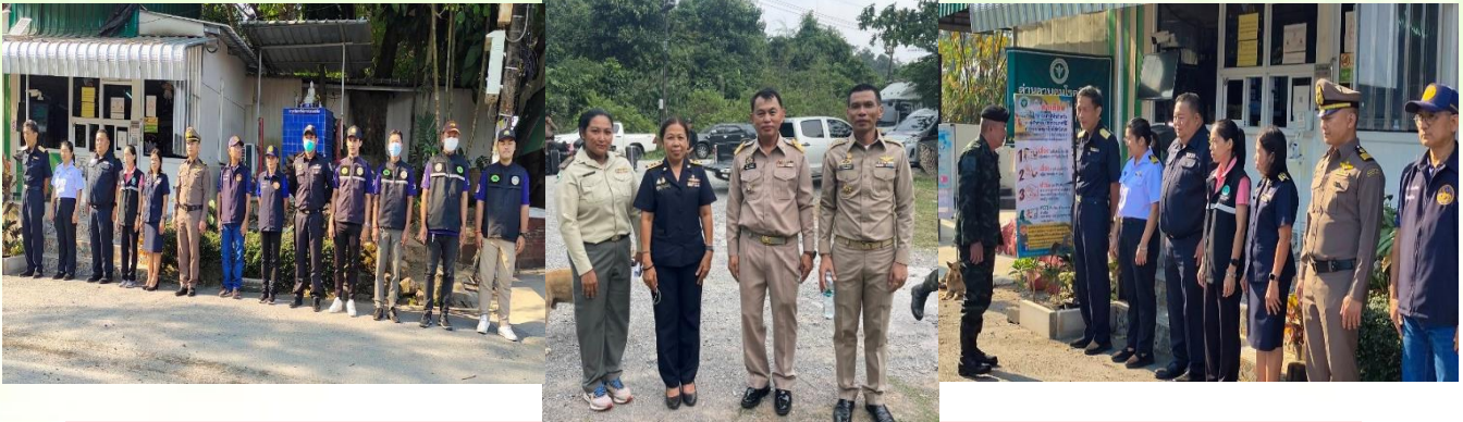
การบูรณาการร่วมกับหน่วยงานต่างๆ ณ จุดผ่านแดนถาวรบ้านหาดเล็ก

ร่วมรับการส่งกลับคนไทย ซึ่งถูกจับกุมในข้อหาลักลอบทำงาน ผิดกฎหมาย (ขบวนการแก๊งคอลเซ็นเตอร์) 2 ครั้ง รวมจำนวน 72 คน