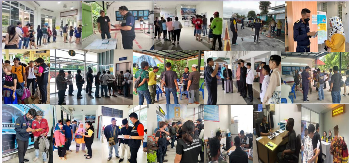
ตรวจสอบผู้ที่มีพฤติกรรมจะลักลอบไปทำงานต่างประเทศผิดกฎหมาย