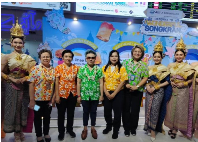
ร่วม กิจกรรมเทศกาลวันสงกรานต์ ประจำปี 2567