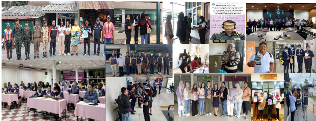
เผยแพร่ข้อมูลข่าวสารการเดินทางไปทำงานต่างประเทศ และประชาสัมพันธ์สร้างการรับรู้การเดินทางไปทำงานต่างประเทศที่ถูกต้องตามกฎหมาย