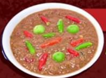
น้ำพริกกะปิ