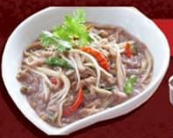
น้ำพริกมะม่วง