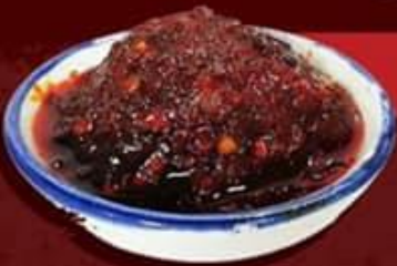
น้ำพริกเผา