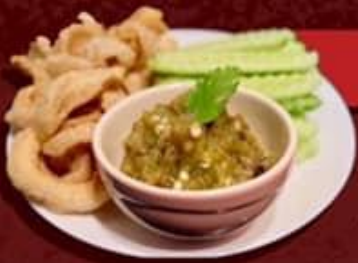
น้ำพริกหนุ่ม