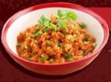
น้ำพริกมะเขือเทศ