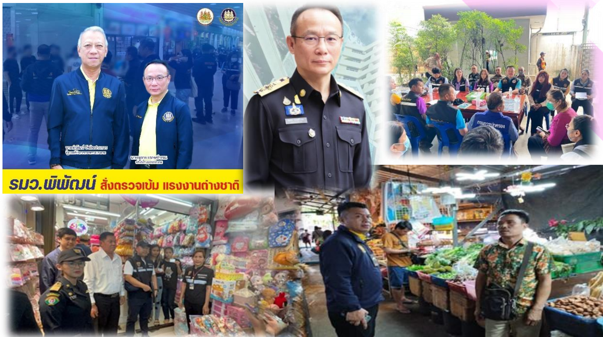
สมว.พิพัฒน์ สังตรวจเข้ม แรงงานต่างชาติ

นายพิพัฒน์ รัชกิจประการ รัฐมนตรีว่าการกระทรวงแรงงาน ได้มอบนโยบายแก่เจ้าหน้าที่ด้านการตรวจสอบการทำงานของแรงงานข้ามชาติ เพื่อใช้เป็นแนวทางการปฏิบัติงานด้านการตรวจสอบ จับกุม และดำเนินคดีนายจ้าง/สถานประกอบการ และคนต่างชาติ ที่กระทำการฝ่าฝืนกฎหมายว่าด้วยการบริหารจัดการการทำงานของคนต่างด้าว การปราบปรามการลักลอบเข้าประเทศตามช่องทางธรรมชาติ และทำงานโดยผิดกฎหมาย รวมทั้งประชาสัมพันธ์และสร้างการรับรู้ให้แก่ นายจ้าง/สถานประกอบการที่จ้างแรงงานข้ามชาติทำงาน และประชาชนทั่วไปให้มีความรู้ ความเข้าใจ ตามพระราชกำหนดการบริหารจัดการการทำงานของคนต่างด้าว พ.ศ. 2560 และที่แก้ไขเพิ่มเติม และการดำเนินการตามประกาศกระทรวงแรงงาน ฉบับลงวันที่ 27 ตุลาคม 2566 เรื่อง การอนุญาตให้คนต่างด้าวทำงานในราชอาณาจักรเป็นกรณีพิเศษ สำหรับคนต่างด้าวสัญชาติกัมพูชา ลาว เมียนมา และเวียดนาม ซึ่งนายจ้างได้ยื่นบัญชีรายชื่อความต้องการจ้างแรงงานต่างด้าวตามมติคณะรัฐมนตรี เมื่อวันที่ 5 กรกฎาคม 2566 และตามมติคณะรัฐมนตรีเมื่อวันที่ 3 ตุลาคม 2566 โดยบูรณาการร่วมกับหน่วยงานด้านความมั่นคงในพื้นที่ เพื่อตรวจสอบ จับกุม และดำเนินคดีนายจ้าง/สถานประกอบการและแรงงานข้ามชาติที่กระทำการฝ่าฝืนพระราชกำหนดการบริหารจัดการการทำงานของคนต่างด้าว พ.ศ. 2560 และที่แก้ไขเพิ่มเติม และเร่งรัดให้นายจ้าง/สถานประกอบการและแรงงานข้ามชาติดำเนินการตามมติคณะรัฐมนตรีเมื่อวันที่ 3 ตุลาคม 2566 โดยกำหนดระยะเวลาดำเนินการ จำนวน 120 วัน ตั้งแต่ 5 มิถุนายน 2567 ถึง 2 ตุลาคม 2567 โดยมีเป้าหมายดำเนินการ ดังนี้