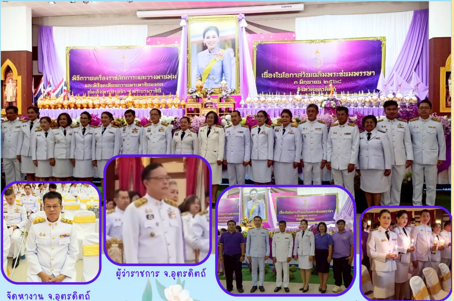
จัดหางาน จ.อุดรดิตร

ร่วมพิธีถวายเครื่องราชสักการะ วางพานพุ่ม และจุดเทียนถวายพระพรชัยมงคล