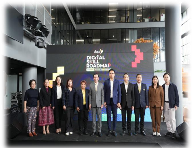
รวบรวมโดย : ศูนย์บริหารข้อมูลตลาดแรงงานภาคเหนือ ที่มา https://mgronline.com/business/detail/9680000061529