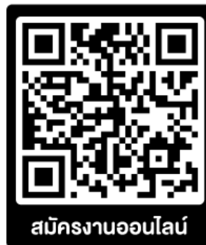
สมัครงานออนไลน์