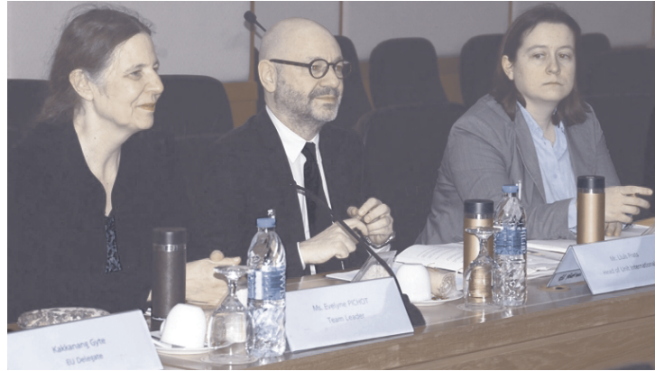
คณะผู้แทนสหภาพยุโรป (EU)

นอกจากนี้ สหภาพยุโรปเสนอแนะให้ประเทศไทยมีพนักงานตรวจแรงงานที่ทำหน้าที่ตรวจแรงงานเพียงอย่างเดียว โดยควรเป็นข้าราชการของกระทรวงแรงงานจริงๆ โดยไม่ใช่พนักงานตรวจแรงงานที่แต่งตั้งจากหน่วยงานอื่น หรือจากพนักงานราชการ ทั้งนี้ เพื่อให้การปฏิบัติหน้าที่มีศักยภาพสูงสุดตามมาตรฐานสากล คณะผู้แทนสหภาพยุโรปลงพื้นที่จังหวัดสมุทรสาคร ตรวจเยี่ยมศูนย์ร่วมบริการช่วยเหลือแรงงานต่างด้าว ศูนย์ PIPO