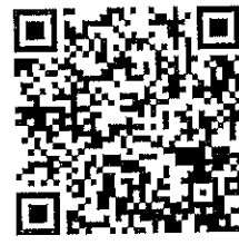
Google form ช่องทางยื่นใบสมัครและเอกสารแนบ