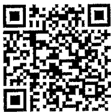
แบบฟอร์มใบสมัคร และใบคำรับรอง

หากต้องการสอบถามข้อมูลเพิ่มเติมได้ที่ สำนักงานเลขานุการ วิทยาลัยนานาชาติ มหาวิทยาลัยเกษตรศาสตร์ ชั้น 6 อาคารระพีสาคริก (หมายเลขโทรศัพท์ 02-5620985 หรือเบอร์ภายใน 618305) ทุกวันในเวลาทำการ (วันจันทร์ถึงวันศุกร์) เวลา 9.00-15.00 น. (พักเที่ยง 1 ชั่วโมง)