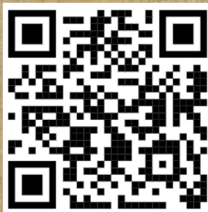
ตำแหน่งงานประจำเดือน