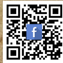
Facebook : สำนักงานจัดหางานจังหวัดเลย