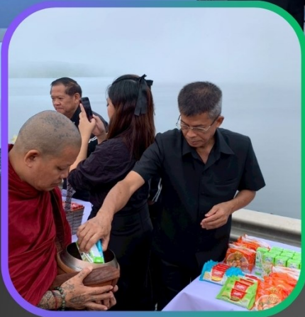
จัดหางานจังหวัดอุดรธานี