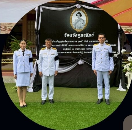
จัดหางานจังหวัดอุดรดิษฐ์