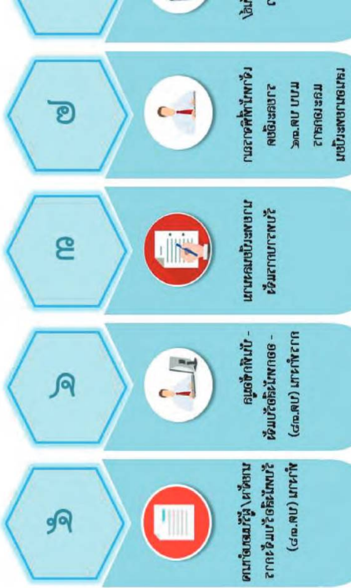
ภาพประกอบ ๑๑