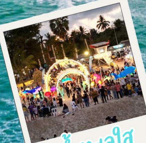
น้ำทะเลใส