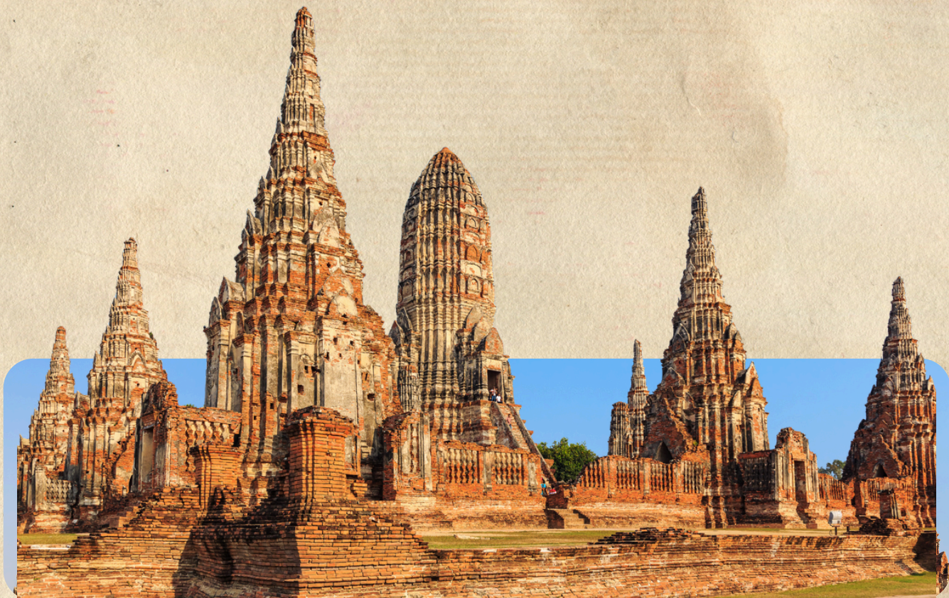
วัดไชยวัฒนาราม