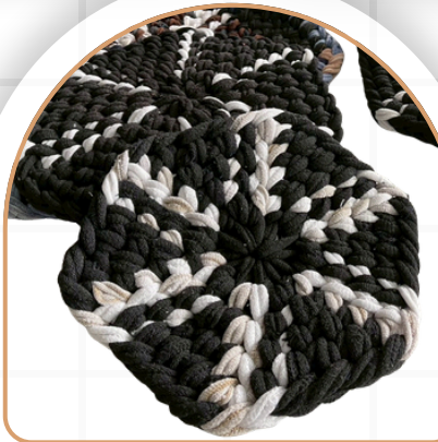
ที่รองภาชนะร้อน