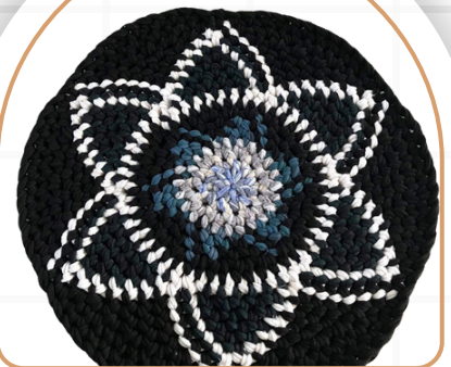
พรมนั่งสมาธิ