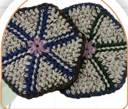
ที่รองนั่งเก้าอี้

เป็นการรวมกลุ่ม ของสมาชิกในชุมชนที่รวมกลุ่มกัน เพื่อประกอบอาชีพ ในการทำพรมอนกประสงค์ ซึ่งสร้างรายได้ให้กับชุมชน จำหน่ายพรมในรูปแบบต่างๆ ทั้ง ที่รองนั่ง พรมเช็ดเท้า กระเป๋า ให้เลือกซื้อเป็นของฝาก ของใช้ในบ้าน