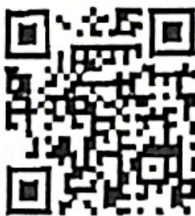
ประกาศรับโอน