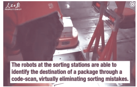
The robots at the sorting stations are able to identify the destination of a package through a code-scan, virtually eliminating sorting mistakes.

กองทัพหุ่นยนต์ส่งพัสดุนี้ มีชื่อว่า Shentongs Army มันสามารถชาร์จแบตเตอรี่ให้ตัวเองได้ สามารถสแกนโค้ดจากพัสดุเพื่อจัดส่งให้ถูกต้องตามฐานข้อมูล และในแต่ละวันมันสามารถทำยอดได้มากถึง 200,000 ชิ้น ที่สำคัญคือมันทำงานได้ตลอด 24 ชั่วโมง ไม่มีวันหยุด และช่วยประหยัดต้นทุนด้านแรงงานได้มากถึง 70%