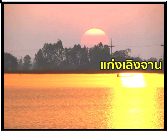
แก่งเลิงจาน