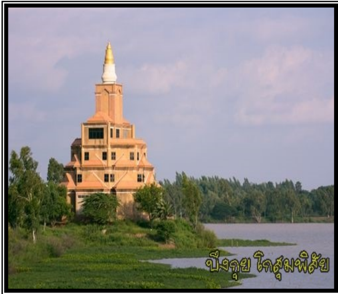
ปรางค์กู่ ใจสุขุมพิสัย

ฉบับที่ ๐๐๔ ประจำเดือน เมษายน พุทธศักราช ๒๕๖๒