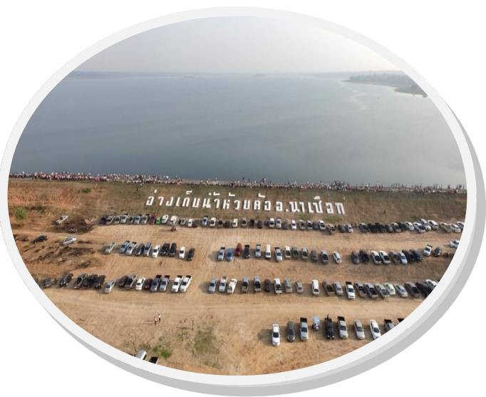
อ่าวเก็บน้ำห้วยค้อ.นาเบือก