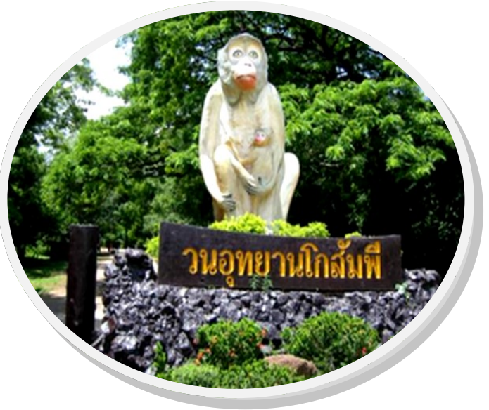
วนอุทยานโกสัมพี