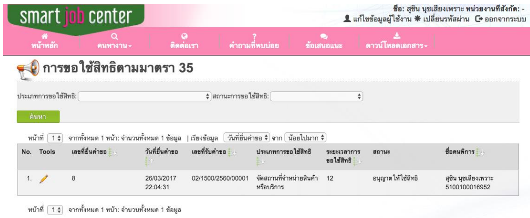
รูปที่ 4 การตรวจสอบการยื่นคำขอขึ้นทะเบียนขอใช้สิทธิตามมาตรา 35