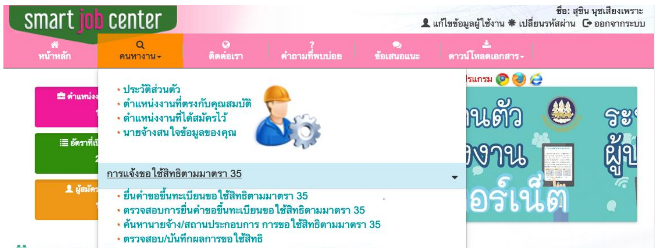
รูปที่ 1 เมนูการแจ้งขอใช้สิทธิตามมาตรา 35 สำหรับคนพิการ

2.1.1. ยื่นคำขอขึ้นทะเบียนขอใช้สิทธิตามมาตรา 35 โดยการเลือกที่เมนู คนหางาน -> ยื่นคำขอขึ้นทะเบียนขอใช้สิทธิตามมาตรา 35