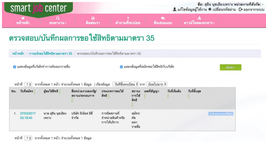
รูปที่ 7 การค้นหาข้อมูลการขอใช้สิทธิ