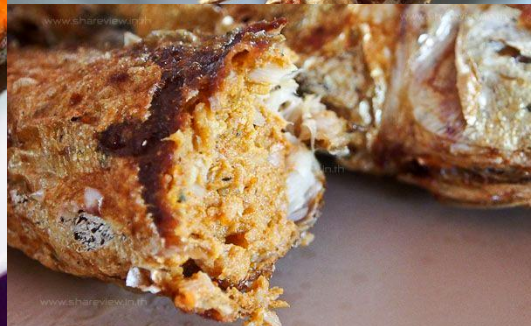
ปลาทอดไส้

เมนูปลาทอดไส้ ปลาทอดคนถูกแต่รสชาติอร่อย ปลาสด ๕๐ บาท ต่อตัว เนื้อปลาผสมเครื่องแกงใต้ (คล้ายๆเครื่องห่อหมก) ไม่ซีก้าง สามารถรับประทานได้ทั้งตัว ใช้วิธีการควักเหงือกปลาทอดออกตามตัวจนหมดเนื้อปลาสด้านในให้เรียบร้อย แล้วค่อยๆ ริดเนื้อออกจนหมด หลังจากนั้นก็นำไปล้างออกจนสะอาด เนื้อปลาที่เอาออกมาก็นำมาเป็นส่วนผสมในการทำไส้ก่อนจะสอดไส้ปลาสดไปในตัวปลาทั้งหางเหงือกเห็ดหอมเค็มแล้วก็เอาไปนึ่ง นึ่งเสร็จแล้วก็ไปทอดไฟอ่อน เป็นอันเสร็จ