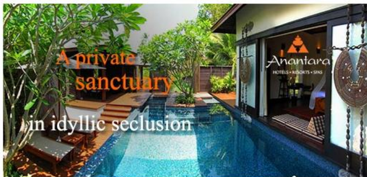
Anantara Mai Khao Phuket Villas อนันตรา ไม้ขาว ภูเก็ต วิลล่า