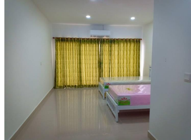
ห้องพักสะอาด พร้อมอุปกรณ์อำนวยความสะดวก (ฟรี)