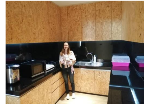
จุดพักเบรก