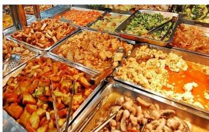
ร้านข้าวแกง