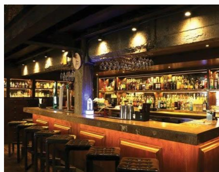
ร้านเหล้า