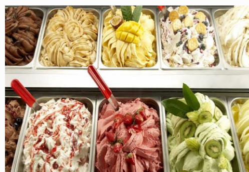
ร้านไอศกรีม