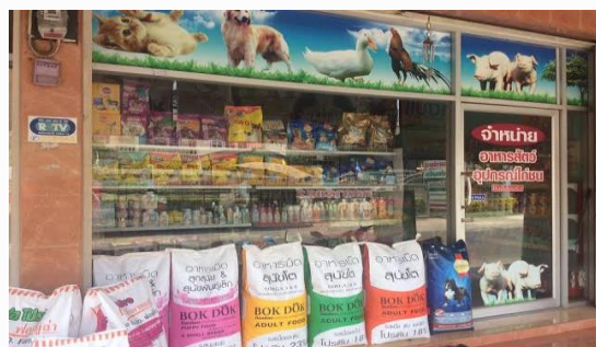
ร้านอาหารสัตว์