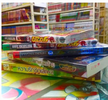
ร้านเช่าหนังสือ