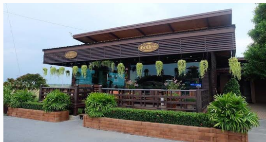
ร้านกาแฟสด