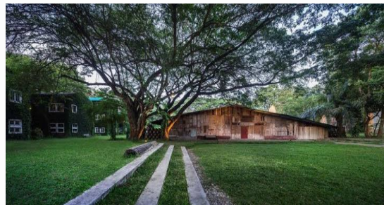
รีสอร์ท ตามสถานที่ท่องเที่ยว