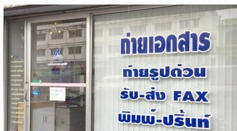
ร้านถ่ายเอกสาร