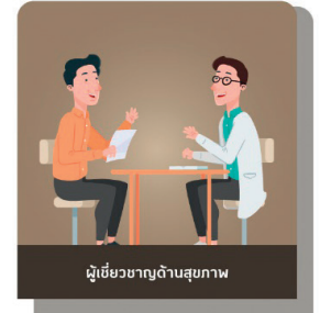
ผู้เชี่ยวชาญด้านสุขภาพ