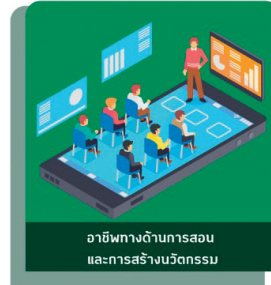
อาชีพทางการสอนและการสร้างนวัตกรรม