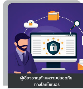
ผู้เชี่ยวชาญด้านความปลอดภัยทางโลกไซเบอร์