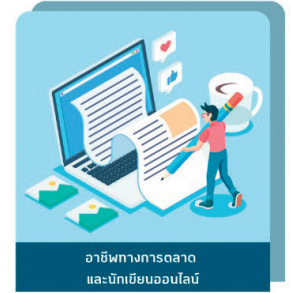
อาชีพทางการตลาดและนักเขียนออนไลน์