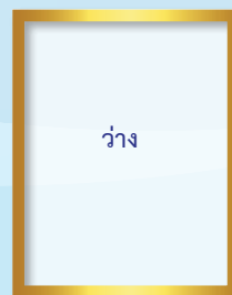
ผู้ตรวจราชการกรม