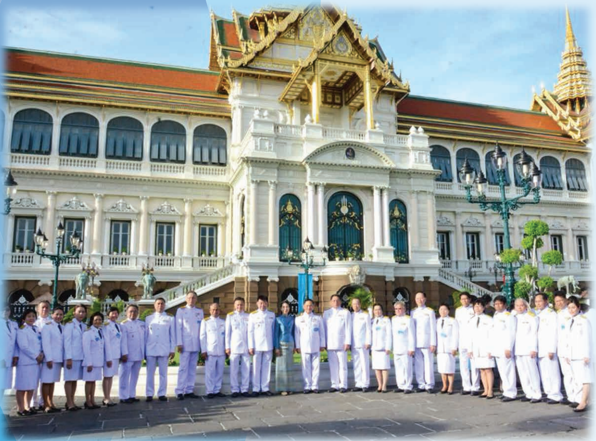
กรมการจัดหางาน กระทรวงแรงงาน