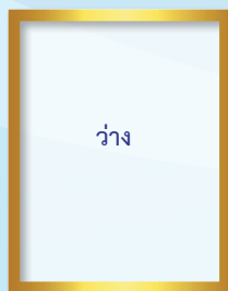
ผู้ตรวจราชการกรม