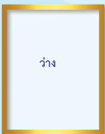
ผู้ตรวจราชการกรม