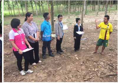
วันที่ 10 และ 18 สิงหาคม 2559 สจจ.สุโขทัยร่วมกับหน่วยงานออกตรวจบูรณาการป้องกันและแก้ไขปัญหาค้ามนุษย์ด้านแรงงาน โดยออกตรวจสถานประกอบการในเขตพื้นที่ อ.ทุ่งสลิ้ม จ.สุโขทัย