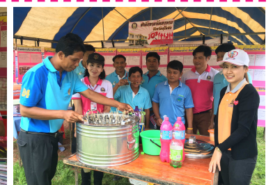
วันที่ 18 สิงหาคม 2559 ออกหน่วยบริการจัดหางานเคลื่อนที่ร่วมกับหน่วยบำบัดทุกข์ บำรุงสุข สร้างรอยยิ้มให้กับประชาชน จังหวัดสุโขทัย ณ สนามกีฬากลางอบต.ไทรโน อ.กงไกรลาศ จ.สุโขทัย