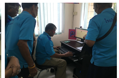
วันที่ 10 สิงหาคม 2559 เปิดศูนย์บริการจัดหางานคนพิการและผู้สูงอายุ จังหวัดสุโขทัย ณ สำนักงานจัดหางานจังหวัดสุโขทัย