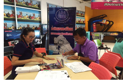
วันที่ 9 สิงหาคม 2559 จัดงานวันนัดพบแรงงาน ครั้งที่ 9/2559 ณ ห้างสรรพสินค้าบิ๊กซีซูเปอร์เซ็นเตอร์ สาขาสุโขทัย ต.บ้านกล้วย อ.เมือง จ.สุโขทัย