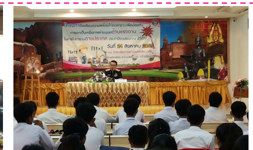
วันที่ 17 และ 24 สิงหาคม 2559 สจจ.สุโขทัยจัดโครงการเตรียมความพร้อมให้คนหางานเพื่อป้องกันการตกเป็นเหยื่อการค้ามนุษย์ด้านแรงงานในการไปทำงานต่างประเทศ ประจำปีงบประมาณ 2559 ณ วิทยาลัยเทคนิคสุโขทัย และ วิทยาลัยการอาชีพศรีสัชนาลัย