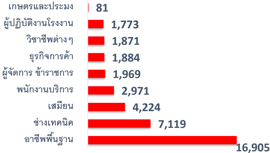
ตำแหน่งงานว่าง