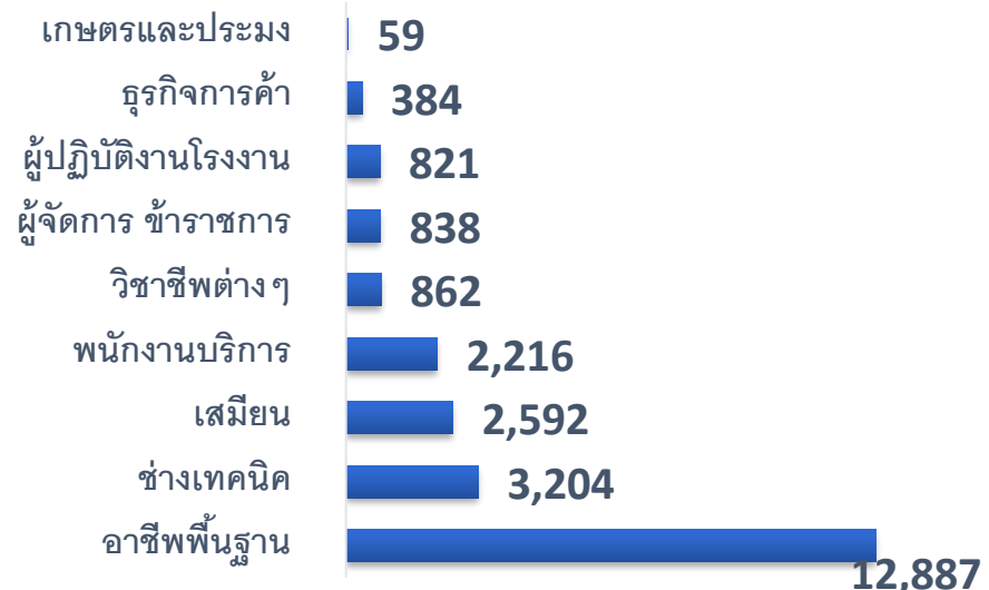
ผู้สมัครงานที่ได้รับบรรจุงาน