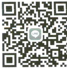
สัมภาษณ์ ๑

๒. ผู้สมัครทุกคนต้องสแกน QR Code กลุ่ม Line สัมภาษณ์ จำนวน ๒ กลุ่ม ภายในวันที่ ๑๙ กรกฎาคม ๒๕๖๔ หากผู้สมัครไม่เข้าร่วมกลุ่มและเพิ่มเพื่อนภายในวันที่กำหนด ถือว่าผู้สมัครไม่ประสงค์จะเข้ารับการสัมภาษณ์ออนไลน์และไม่มีสิทธิเข้ารับการประเมินครั้งนี้