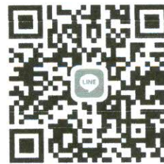
สัมภาษณ์ ๒

๓. กรณีไม่ประสงค์เข้ารับสัมภาษณ์ครั้งนี้ กรุณาแจ้งในกลุ่มสัมภาษณ์พนักงานราชการเฉพาะกิจ