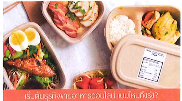
เริ่มจับธุรกิจขายอาหารออนไลน์ แบบไหนถึงรุ่ง?