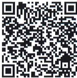
บต.๒๕ คำขออนุญาตทำงาน และต่ออายุใบอนุญาตทำงาน

- ครบเวลาการอนุญาตตั้งแต่วันที่ ๔ สิงหาคม ๒๕๖๕ เป็นต้นไป ต้องขอตรวจอนุญาตให้อยู่ในราชอาณาจักรเป็นการชั่วคราวต่อไป ภายใน ๖ เดือน ระยะเวลาที่แรงงานต่างด้าวได้รับอนุญาตให้ทำงานแต่ไม่เกิน ๒ ปี อัตราค่าธรรมเนียมเป็นไปตามกฎหมายว่าด้วยคนเข้าเมือง