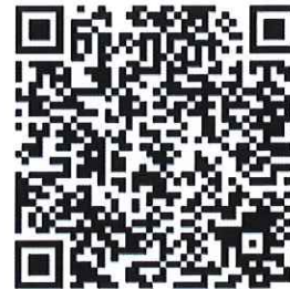
บต.๔๖ หนังสือรับรองการ

ติดต่อสอบถามรายละเอียดเพิ่มเติมได้ที่ สำนักงานจัดหางานจังหวัดสิงห์บุรี