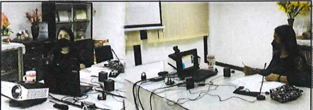
◆ นางเจนจิรา เดชะรัฐ จัดหางานจังหวัดสิงห์บุรี มอบหมายให้เจ้าหน้าที่สำนักงานจัดหางานจังหวัดสิงห์บุรี เข้าร่วมการประชุมคณะทำงานพิจารณากลับกรองเงินกองทุนส่งเสริมและพัฒนาคุณภาพชีวิตคนพิการจังหวัดสิงห์บุรี ครั้งที่ ๖/๒๕๖๔ เพื่อให้การดำเนินการพิจารณากลับกรองเงินกองทุนส่งเสริมและพัฒนาคุณภาพชีวิตคนพิการเป็นไปอย่างมีประสิทธิภาพ ผ่านระบบประชุมออนไลน์ ณ ห้องประชุมสำนักงานจัดหางานจังหวัดสิงห์บุรี ศาลากลางจังหวัดสิงห์บุรี ◆