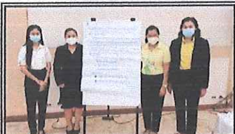
◆เจ้าหน้าที่สำนักงานจัดหางานจังหวัดสิงห์บุรี เข้าร่วมโครงการประชุมเชิงปฏิบัติการติดตามผลแผนพัฒนาคุณภาพชีวิตคนพิการจังหวัด และจัดทำแผนปฏิบัติการประจำปี ๒๕๖๕ ณ ห้องประชุมจุฑามาศ ภัตตาคารไพบูลย์ไถ่ย่างจังหวัดสิงห์บุรี ◆