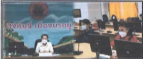
◆ เจ้าหน้าที่สำนักงานจัดหางานจังหวัดสิงห์บุรี เข้าร่วมประชุมผู้ประกอบการด้านการท่องเที่ยวเครือข่ายท่องเที่ยว และชุมชน/พื้นที่ของจังหวัดสิงห์บุรี ณ ห้องประชุมขุนสรรค์พื้นเรื่อง ชั้น ๕ ศาลากลางจังหวัดสิงห์บุรี (หลังใหม่) อำเภอเมืองสิงห์บุรี จังหวัดสิงห์บุรี โดยมีนายสัมฤทธิ์ กองเงิน รองผู้ว่าราชการจังหวัดสิงห์บุรี เป็นประธาน ◆