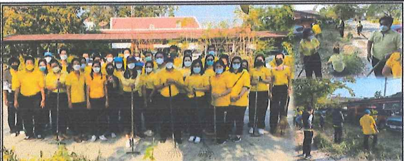
◆สำนักงานจัดหางานจังหวัดสิงห์บุรี ร่วมกับสำนักงานสวัสดิการและคุ้มครองแรงงานจังหวัดสิงห์บุรี เข้าร่วมกิจกรรมจิตอาสาพัฒนาบริเวณศูนย์ราชการจังหวัดสิงห์บุรี เพื่อปรับปรุงภูมิทัศน์และทำความสะอาด (Big Cleaning Day) ตามโครงการ "สิงห์บุรี เมืองสะอาดคนสุขภาพ (Exercise for Clean)" ณ บริเวณศูนย์ราชการจังหวัดสิงห์บุรี ศาลากลางจังหวัดสิงห์บุรี อำเภอเมืองสิงห์บุรี จังหวัดสิงห์บุรี ◆