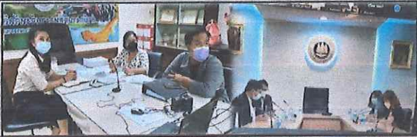
◆เจ้าหน้าที่สำนักงานจัดหางานจังหวัดสิงห์บุรี เข้าร่วมประชุมการติดตามเงินอุดหนุนการจ้างงานตามโครงการส่งเสริมการจ้างงานใหม่สำหรับผู้จบการศึกษาใหม่โดยภาครัฐและเอกชน (Co-Payment) ผ่านระบบโปรแกรม Zoom ณ ห้องประชุมสำนักงานจัดหางาน ศาลากลางจังหวัดสิงห์บุรี ◆