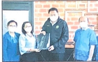
นายสุชาติ ช่มกลิ่น รัฐมนตรีว่าการกระทรวงแรงงาน